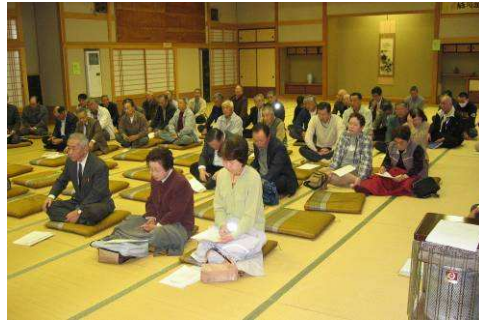
昨年度の合同総会の様子