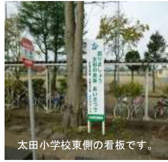
太田小学校東側の看板です。