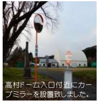
高村ドーム入口付近にカーブミラーを設置致しました。