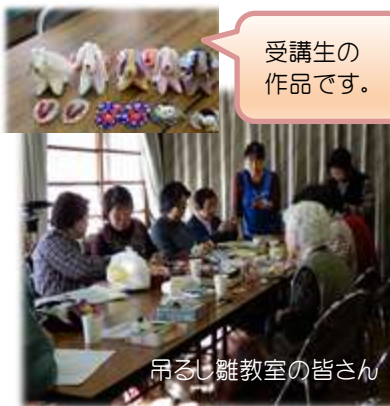
受講生の作品です。

2月1日(木)NHKの取材があり、翌日受講生の皆さんの様子が、県内に放送されました。