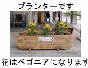
プランターです 花はベゴニアになります

花主は、実行委員会から木製プランターの提供を受け、振興センターなどに設置し、管理します。