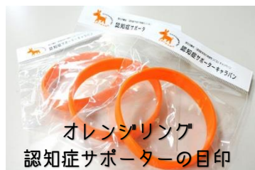
オレンジリング 認知症サポーターの目印