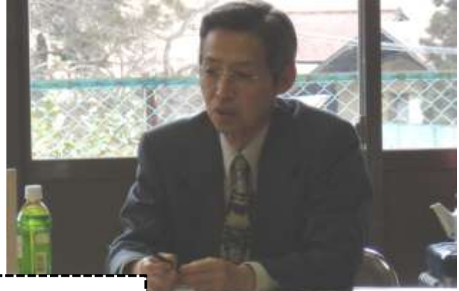
地域福祉懇談会の様子