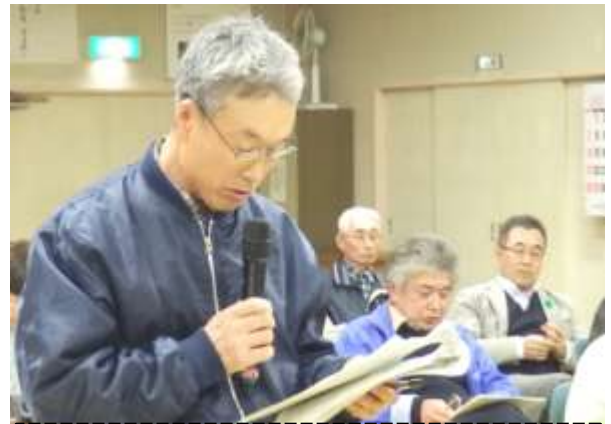
平成25年度春季市政懇談会の様子