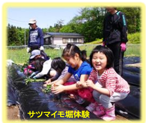
サツマイモ掘体験