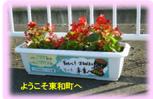
ようこそ東和町へ