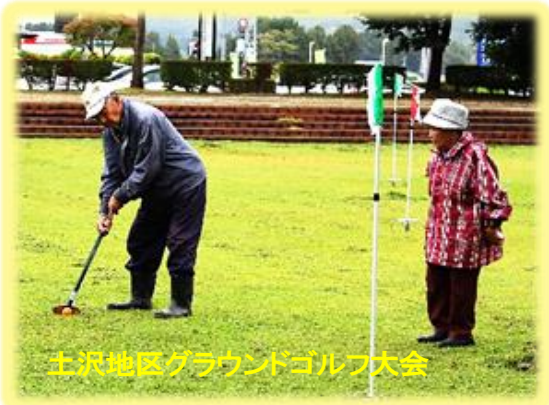
土沢地区グラウンドゴルフ大会