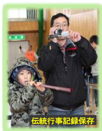
伝統行事記録保存