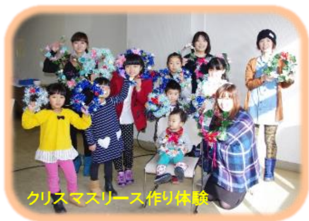
クリスマスリース作り体験