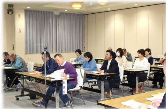
29人が出席し、28年度事業計画等を決定した通常総会の様子

新たな地域づくりに向かつては、人口減少・高齢化・空き家問題など大きな課題を背負いながら進めなければなりません。この課題解決に向かつて地域住民一人ひとりの参加が必要ですから、みなさまのご協力をお願いいたします。