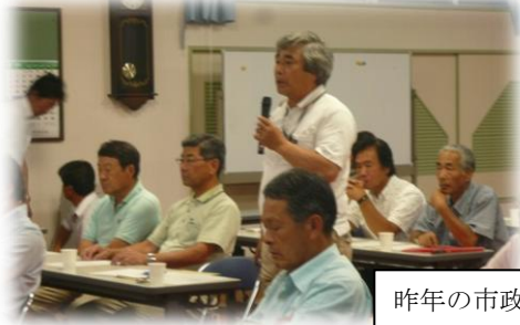
昨年の市政懇談会より