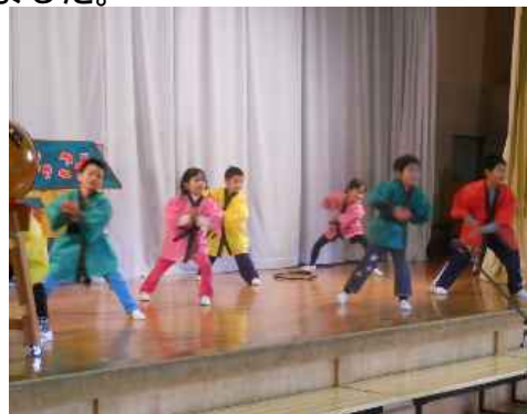
小学1年生の演技 「げんき玉 とばせ」 来場者に元気を いっぱいプレゼント！！