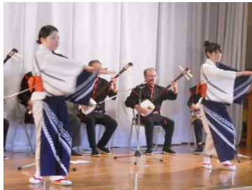
東和三弦会 三味線や踊り、 唄を披露