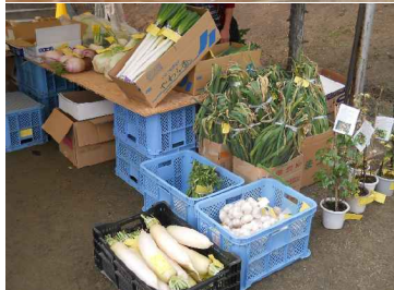
農産物即売会 多数の出品 ありがとうございました