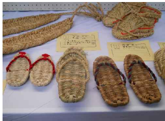
作品展 示では、 全240点 と多数 出品