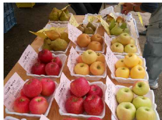
きれいな いろいろ ひときわ 映えた リンゴ