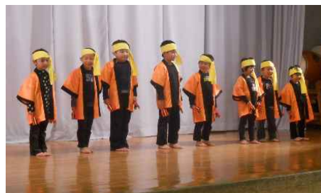
保育園の遊戯は、 「よさこいDancing」 リズムに合わせて 踊りました