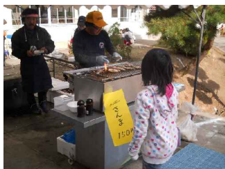
三陸町 崎浜から 海産物 即売会