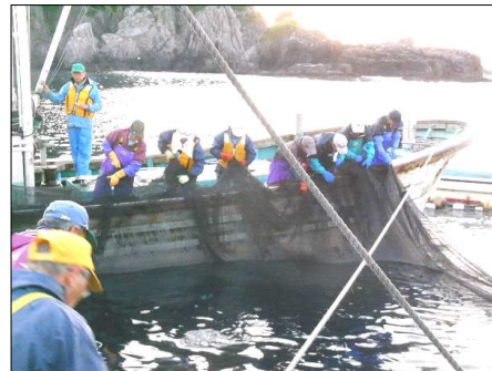
定置網の作業の様子