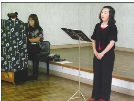
左右マ ががミ ががミ 金子千 子葉ズ ささの ん

途中でくまさんがでてきたり、リズムに合わせて踊ったりと、楽しい時間を過ごすことができました。