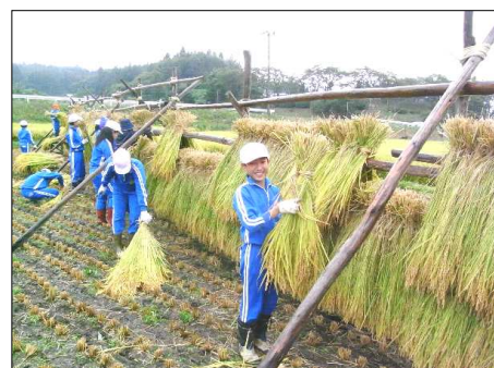
は せ が け の 様 子

現在の稲刈りは機械化しましたが、昔の稲刈り体験ができてよかった。稲を束ねることが大変でした。と昔の稲刈りの大変さが実感できた様子でした。