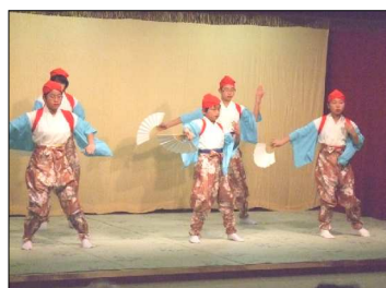
左上 崎浜念仏剣舞 右上 中内大神楽しし舞 右下 中内大神楽えびす舞