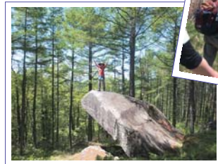
トレッキングツアーの様子。すがすがしい天気の中、大迫の自然を満喫しました