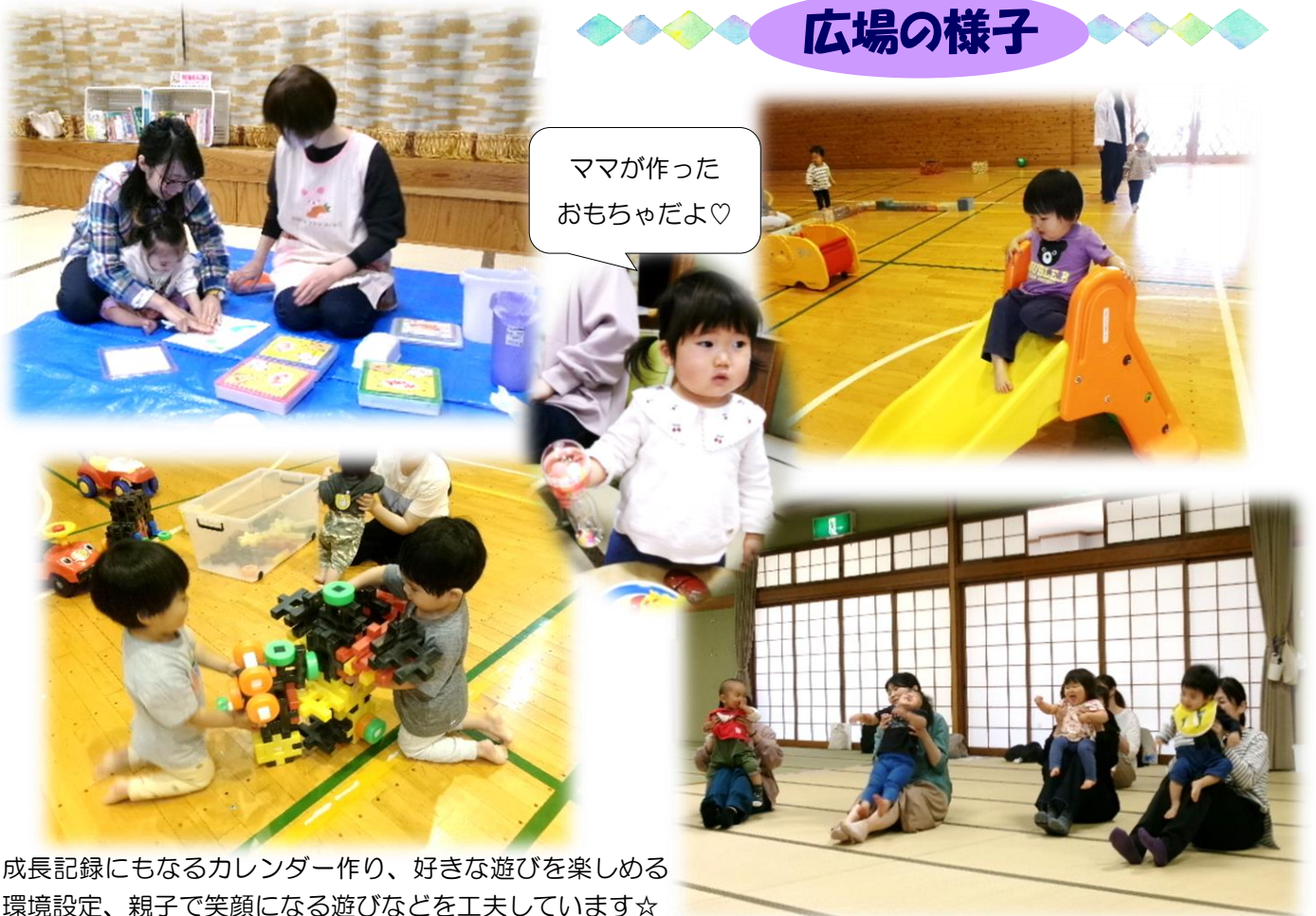
成長記録にもなるカレンダー作り、好きな遊びを楽しめる環境設定、親子で笑顔になる遊びなどを工夫しています☆