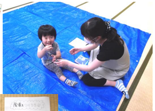
スケルトンの風車 ママと一緒に 「さあ〜作るよお〜!」