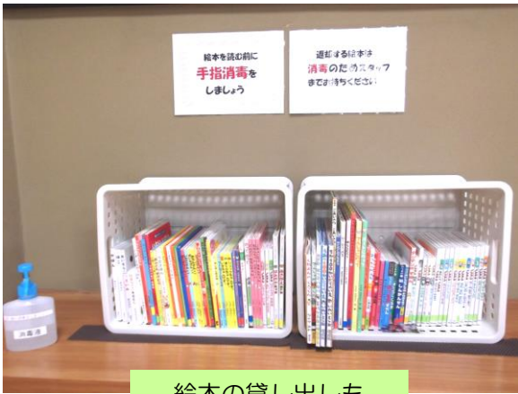
絵本の貸し出しも 再開しました!!