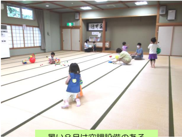
暑い8月は空調設備のある 振興センターで快適に♡