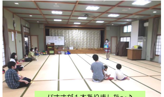
バナナが1本ありました〜♪ パネルシアター楽しく見たね!