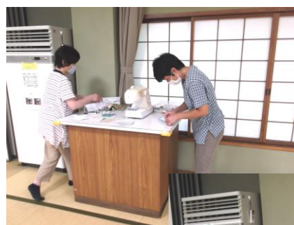
ママたちはマスク作り 頑張りました☆☆