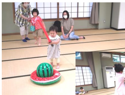
スイカ割りごっこ♡ 楽しかったね!!