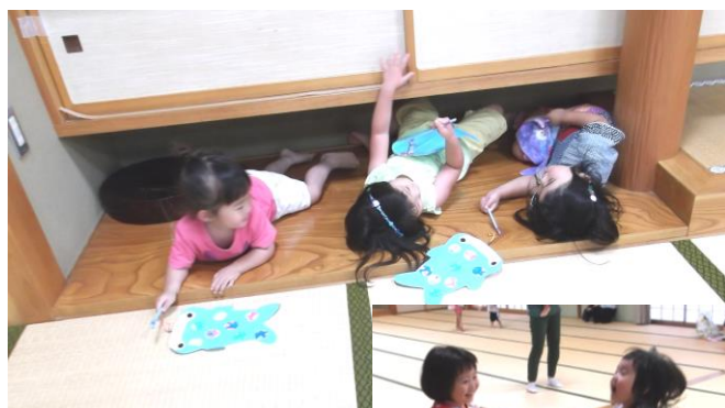
友達と一緒にだと 何をしても面白い♡