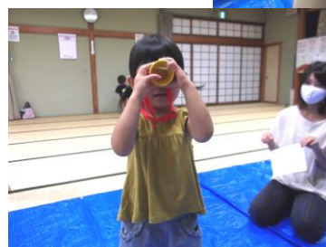
望遠鏡作ったね! 何が見えるかな~?