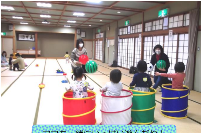
ママも一緒にいっぱい遊んだね！