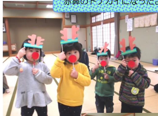
赤鼻のトナカイになったよ☆