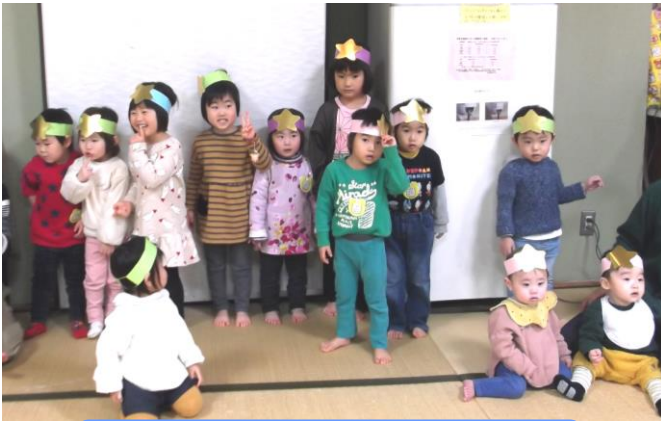
クリスマス会★みんなでパチリッ！ プレゼントはラーメンセット♡