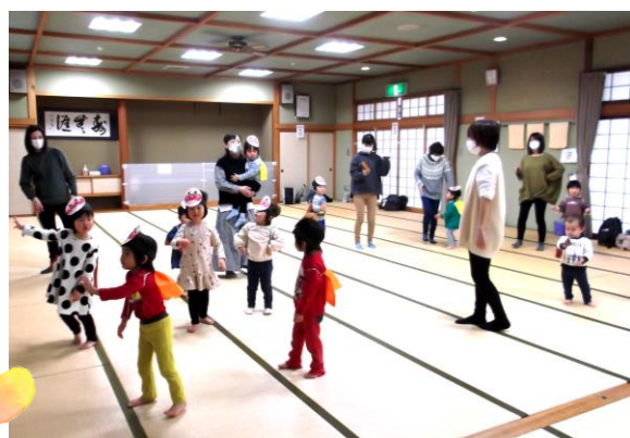
アンパンマンになって元気に体操♡