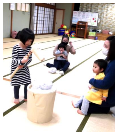
ぺったん！ぺったん！お餅つき☆