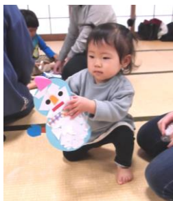
ちぎって貼って！雪だるま作ったよ☆