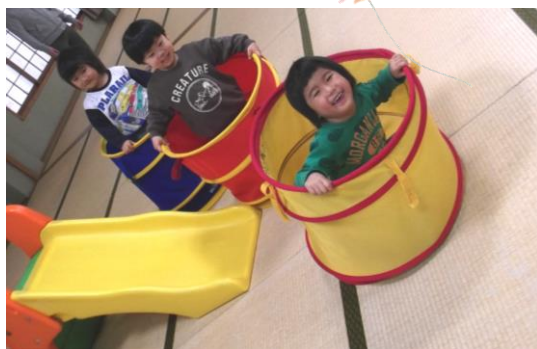
繋がって〜電車ごっこ！楽しいな！