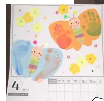
カレンダーを持ち帰るためのエコバック等をお持ちくださいね!