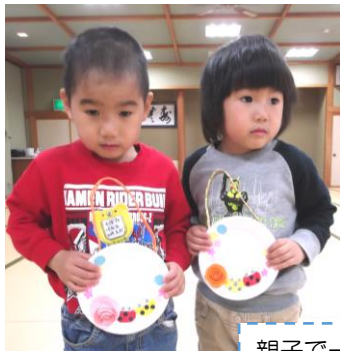
親子で一緒に製作