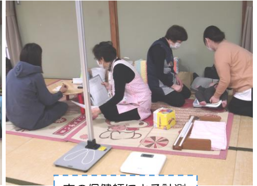
市の保健師による計測