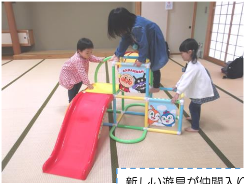
新しい遊具が仲間入り♪