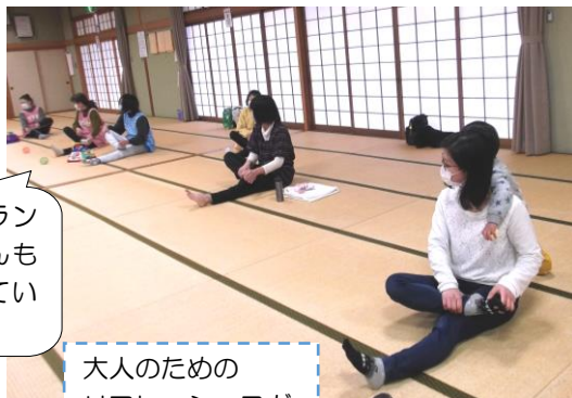
地域のボランティアさんも遊びに来ています♡