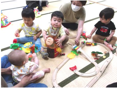
乗り物のおもちゃは男の子に大人気!