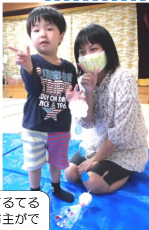
てるてる坊主ができたよ