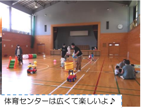
体育センターは広くて楽しいよ♪