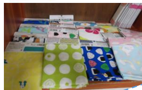
3歳のお子さんがはくとこんな感じです☆