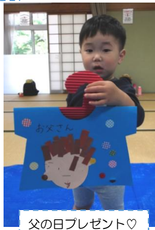
父の日プレゼント♡