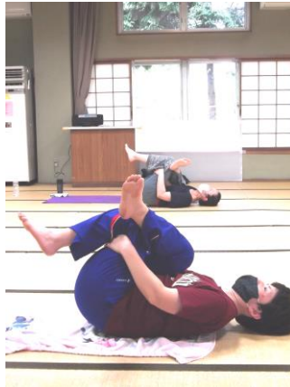
ヨガ講座でリフレッシュ