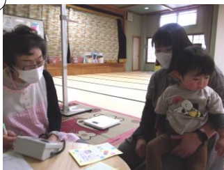
計測・個別相談は2か月に1度になります 次回は8月19日です