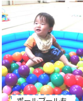
ボールプールも登場しました☆