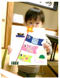
人気のカレンダー作り☆