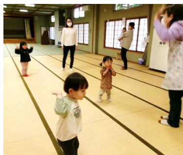
歌をうたったり体操したり みんなと一緒に楽しいね