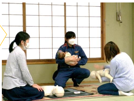
女性消防隊員による講話と実技

「乳幼児救急」についての講話を人形を使って指導して下さっています。「聞いていたので高熱がでた時焦らず対処することができました!」「聞いたつもりでも忘れることがあるので繰り返し聞けるのはいいですね!」など、利用者さんから感想をいただいています