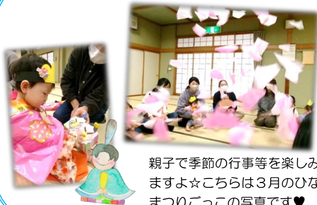
親子で季節の行事等を楽しみますよ☆こちらは3月のひなまつりごっこの写真です♥