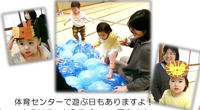
体育センターで遊ぶ日もありますよ！ こちらは森のおふろごっこの写真です