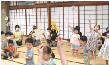
スタッフによるペープサートにみんな釘付け! バナナを持ってみんなで歌って楽しかったね♪