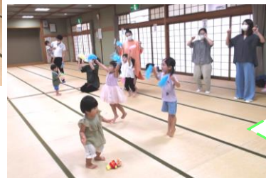
暑い夏の間も体操で体をたくさん動かして元気いっぱい過ごしたね!