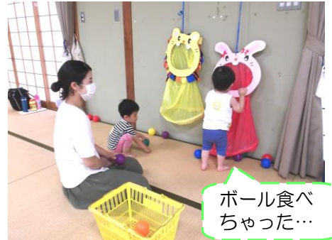
ボール食べちゃった…