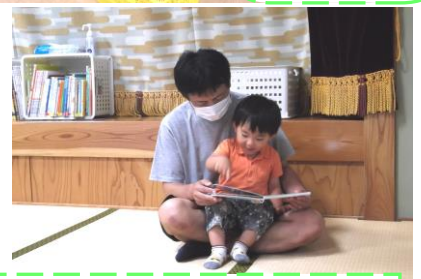
パパたちの参加も増えています☆