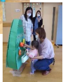
「ぶどう狩りごっこ」の様子