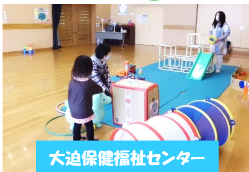
大迫保健福祉センター