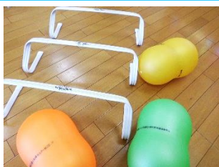
☆ミニハードルと ピーナッツボール☆