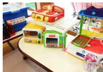
☆おままごとコーナー☆