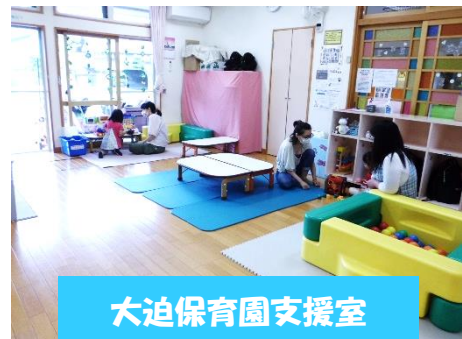
大迫保育園支援室