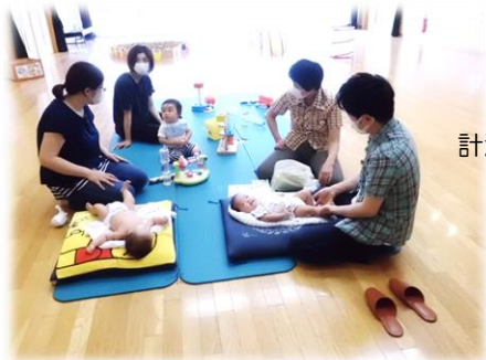
*すくすくひろば* 計測の合間のおしゃべりも たのしそう♡