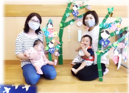
*七夕ごっこ* 笹飾り☆力作が完成!! ママ頑張りました!