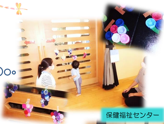
保健福祉センター