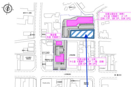
子育て世帯向け 地域優良賃貸住宅