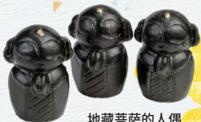
地藏菩萨的人偶 (南部铁器)