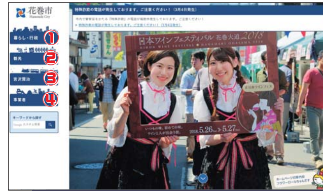
新ホームページでは、総合トップページを採用。「花巻の四季」が感じられる写真で皆さんをお出迎えします

※「犬が死亡した」「飼い主の住所が変わった」など、登録内容に異動あった場合は手続きが必要です