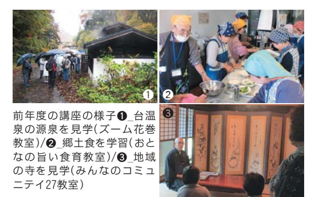
前年度の講座の様子① 台温泉の源泉を見学(ズーム花巻教室)/② 郷土食を学習(おとなの旨い食育教室)/③ 地域の寺を見学(みんなのコミュニティ27教室)