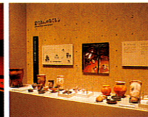
北の文化と南の文化