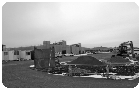
9月開業に向けて工事が進む道の駅「はなまき西南」

国から公共工事の平準化について、「公共工事の品質確保の促進に関する法律」に基づき通知が令和元年10月にあった。今後、設計等の準備が整った工事については、債務負担行為を活用することも考える。