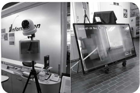
本庁舎入り口に設置されたサーモグラフィーカメラとモニター

◆令和2年度花巻市一般会計補正予算(第4号) ↓新型コロナウイルス感染症の影響を受ける市内事業所等への支援対策、国庫補助金の内定に伴う生活道路整備事業等に係る歳入歳出予算の補正および地方債の補正。 歳入歳出予算の総額に3億5659万7千円を追加するもの。