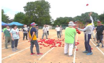
昨年の交流運動会