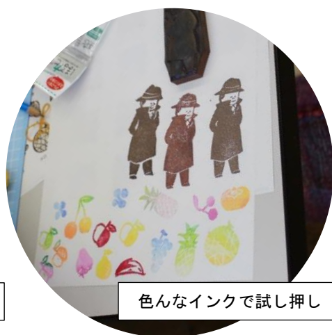
色々なインクで試し押し