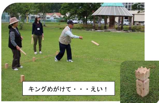
キングめがけて・・・えい！