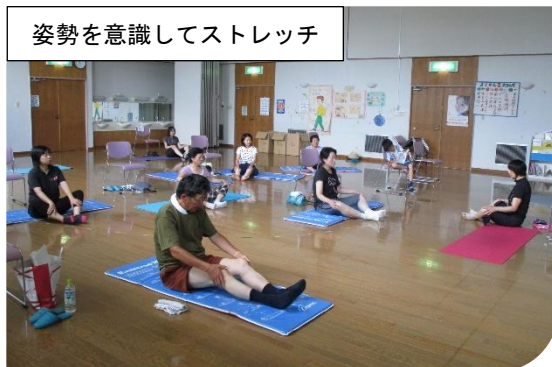
姿勢を意識してストレッチ

夜の部(9月17日・24日 19:00~20:30)の定員に余裕がありますので、ご参加おまちしています。