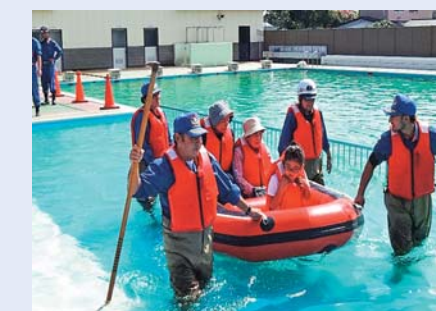
▲住民救出訓練の様子