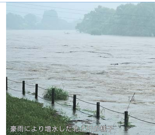
豪雨により増水した北上川の様子