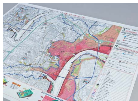
▲花巻市ハザードマップ