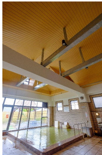
梁と天井の改修を行った男性浴室