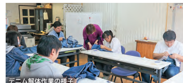
デニム解体作業の様子