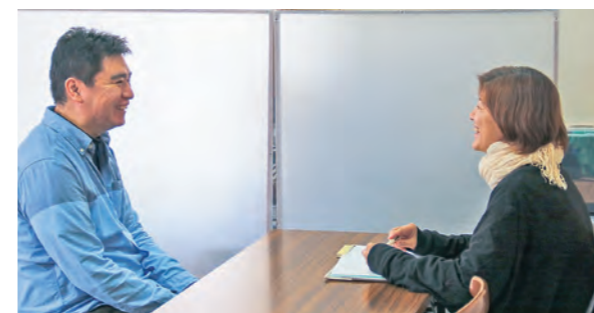
▲スタッフが笑顔で相談に応え、利用者をサポートします

さらに同事業所の法人元のココ・アルバでは、各種講座や相談支援など、さまざまな事業を展開。障がいのある人だけでなく、困り事のある人を支援することで、「困り事のない社会」の実現を目指しています。