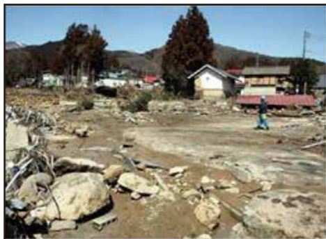
濁流が襲ったため池下流の集落

近年、局地的な大雨や大規模な地震の発生などにより、ため池の被害が各地で発生しています。東日本大震災の際には、福島県の農業用ダムが決壊し、死者、行方不明者8名、家屋全壊22戸等の甚大な被害をもたらしています。また、平成30年7月豪雨では、西日本で32箇所のため池が決壊し、下流の住民へ大きな被害が及んでいます。