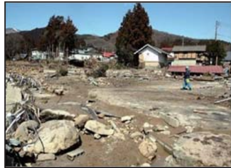
濁流が襲ったため池下流の集落

近年、局地的な大雨や大規模な地震の発生などにより、ため池の被害が各地で発生しています。東日本大震災の際には、福島県の農業用ダムが決壊し、死者、行方不明者8名、家屋全壊22戸等の甚大な被害をもたらしています。また、平成30年7月豪雨により、西日本で32箇所のため池が決壊し、下流の住民へ大きな被害が及んでいます。