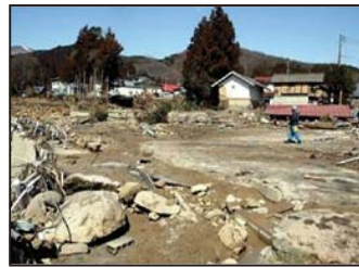
濁流が襲ったため池下流の集落

近年、局地的な大雨や大規模な地震の発生などにより、ため池の被害が各地で発生しています。東日本大震災の際には、福島県の農業用ダムが決壊し、死者、行方不明者8名、家屋全壊22戸等の甚大な被害をもたらしています。また、平成30年7月豪雨により、西日本で32箇所のため池が決壊し、下流の住民へ大きな被害が及んでいます。