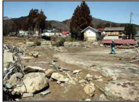
濁流が襲ったため池下流の集落

近年、局地的な大雨や大規模な地震の発生などにより、ため池の被害が各地で発生しています。東日本大震災の際には、福島県の農業用ダムが決壊し、死者、行方不明者8名、家屋全壊22戸等の甚大な被害をもたらしています。また、平成30年7月豪雨では、西日本で32箇所のため池が決壊し、下流の住民へ大きな被害が及んでいます。