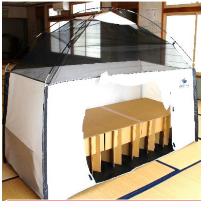
1人用テントとダンボールベッド

八幡地区自主防災会連絡協議会(山陰義博会長)は、今年度防災備品の整備として避難所用ひなんルーム(1人用テント)と組立式ダンボールベッド2組を購入し、八幡まちづくり協議会はその費用の一部を補助しました。