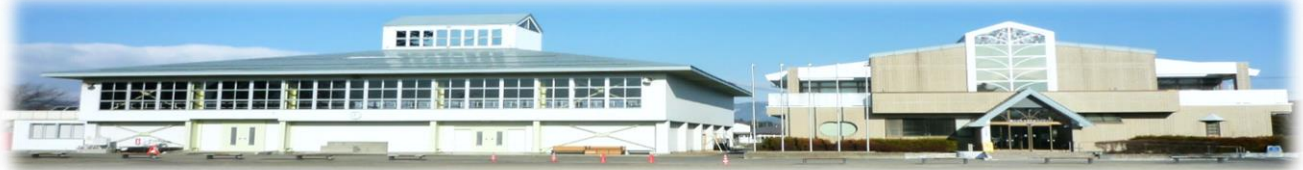
ビバハウスいしどりや

〒028-3101 花巻市石鳥谷町好地 8-78-3 (石鳥谷国際交流センター内) 問合せ・申込み ☎ 0198-45-6639 (好地振興センター内)