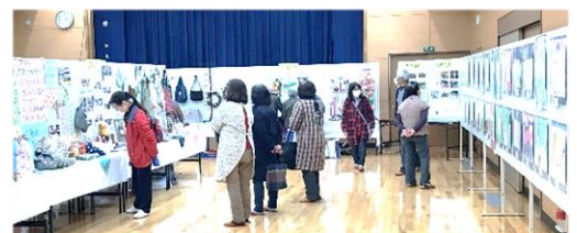
地区民文化祭の様子（石鳥谷国際交流センター）