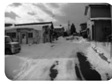
除雪が困難な方に支援を実施しています

市の支援として、シルバー人材センターへの委託事業により、低料金で利用できる方法と、地域の総合事業による生活支援、コミュニティ会議負担の有償ボランティア除雪支援がある。除雪が困難な場合、区長を通して、市の道路課にご相談いただきたい。