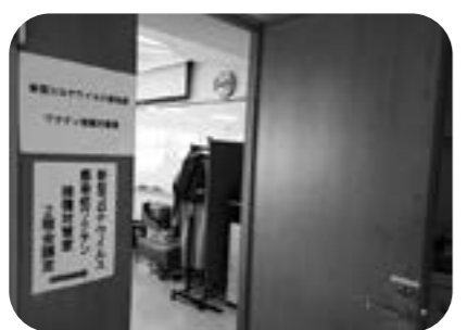
花巻保健センターに設置された新型コロナウイルス感染症ワクチン接種対策室

国の示す順位は、医療従事者、65歳以上の方、基礎疾患のある方、高齢者施設等の従事者、60歳から64歳の方となっております。自治体はこれを変更できない。一般的には高齢者の方は死亡率が高い傾向にある。そのことからすると市としても考えなければならぬが、市のみで判断することはできないものである。