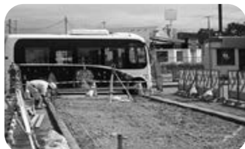
12月完成予定のイトーヨーカドーバス待合所

や生活支援、公共交通利用促進等を目的に、高齢者が低料金で公共交通を利用でき、県内では盛岡市が実施している。実施には課題もあるが、高齢者を対象とした利用策について、シルバーバスにこだわらず岩手県交通株式会社とともに検討していく。