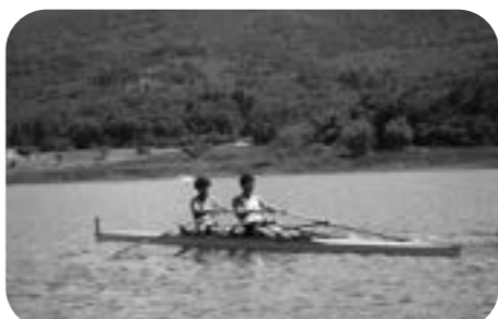
日本代表チームが合宿した田瀬湖ボート場

ボート競技では、日本代表チームとして、これまでにない上位成績を収め、コロナ禍の中、合宿受け入れに感謝の言葉が寄せられた。復興ありがとうホストタウンでは、アメリカやオーストラリアに対し感謝の意を伝えた。さらに継続して相手国との交流を図っていく。