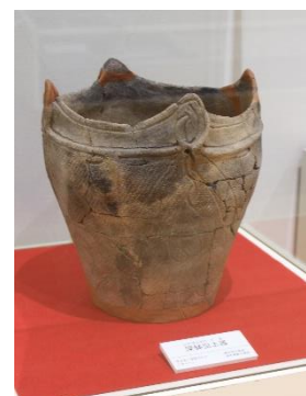
出土した「深鉢型土器」逆さまに埋設されていました。

遺跡の周辺はかつて沼地で、配石遺構等がつけられた場所は中島となっていました。遺跡から400mほど北西には、同時期の配石遺構が確認されている安俵6区遺跡が所在しており、この一帯には縄文時代後期の祭祀場が広がっていたと考えられます。