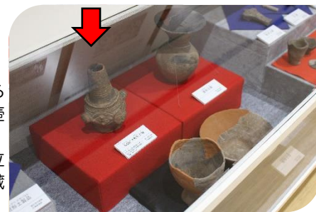
石鳩岡遺跡から出土した「人面付壺型土器（レプリカ）」 本物は、新潟県立歴史博物館に所蔵されています。

調査では住居跡は発見されておらず、土偶をはじめとする特殊な遺物が数多く出土していることから、祭祀（マツリや呪い）に関する場所ではないかと考えられています。