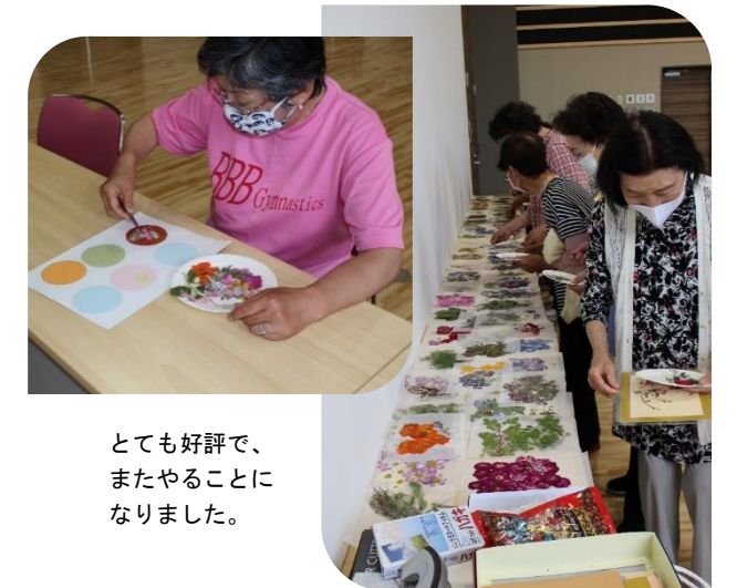
とても好評で、またやることになりました。

普段は3B体操で体を動かしリフレッシュ、日々の生活をエンジョイしているカトリア会の皆さんが、この日（7月2日）は、押し花のコースター作りを楽しみました。色とりどりの押し花を選んで、オリジナルのコースターを完成させ、「きれいね」…と心もリフレッシュ。皆さん、一際輝いていました。