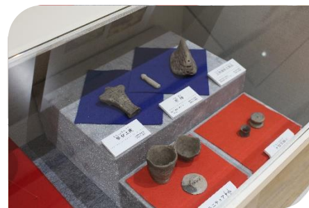
安俵6区遺跡から出土したミニチュア土器 祭祀の道具と考えられています。

出土品には、赤色顔料で彩色された土器のほか、土偶、三角壺形土製品、タカラ貝形土製品などの珍しい形状をした特殊な遺物が数多くあります。