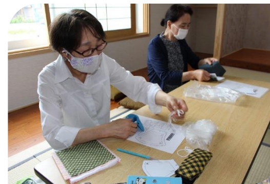
最近ではカンタンに購入できるようになりましたが、手作りにこだわって…