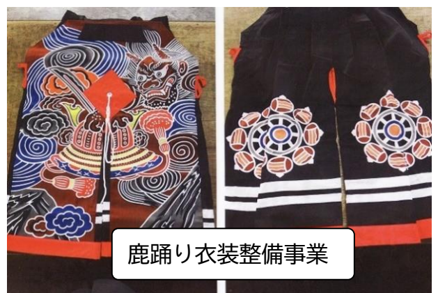
鹿踊り衣装整備事業