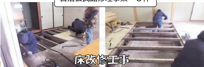
自治公民館修理事業 8件