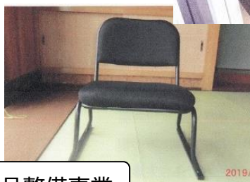
自治公民館備品整備事業